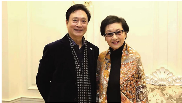
▲2014年11月16日梁波罗与夏梦在上海电影博物馆

长久以来,在人们对港台女星的印象中,夏梦似香港的林青霞,林青霞好比台湾的夏梦,尽管两人年龄相差20多岁,处于不同年代,但她俩同样玉洁冰清,端庄典雅,皆为大众崇尚的“女神”。为什么大陆乃至东南亚观众对夏梦情有独钟呢?不仅因为她的颜值、她的演技,更源于她的真诚。在纸醉金迷的香港,浸淫演艺圈半个多世纪的她,没有随波逐流,没有迷失自我,自她从影之日起就恪守自律的“不剪彩、不陪饭、不拍不健康的戏”的约法三章,潜心演戏,心无旁骛,因此在她主演的38部影片中佳作不断,她的表演因真诚而历久弥新。